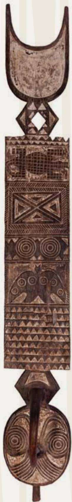
Máscara placa (Nwantantay) Povos Bobo, Bwa (Bwaba ou Oule) Burkina Faso Madeira pintada 232 x 45 x 34 cm