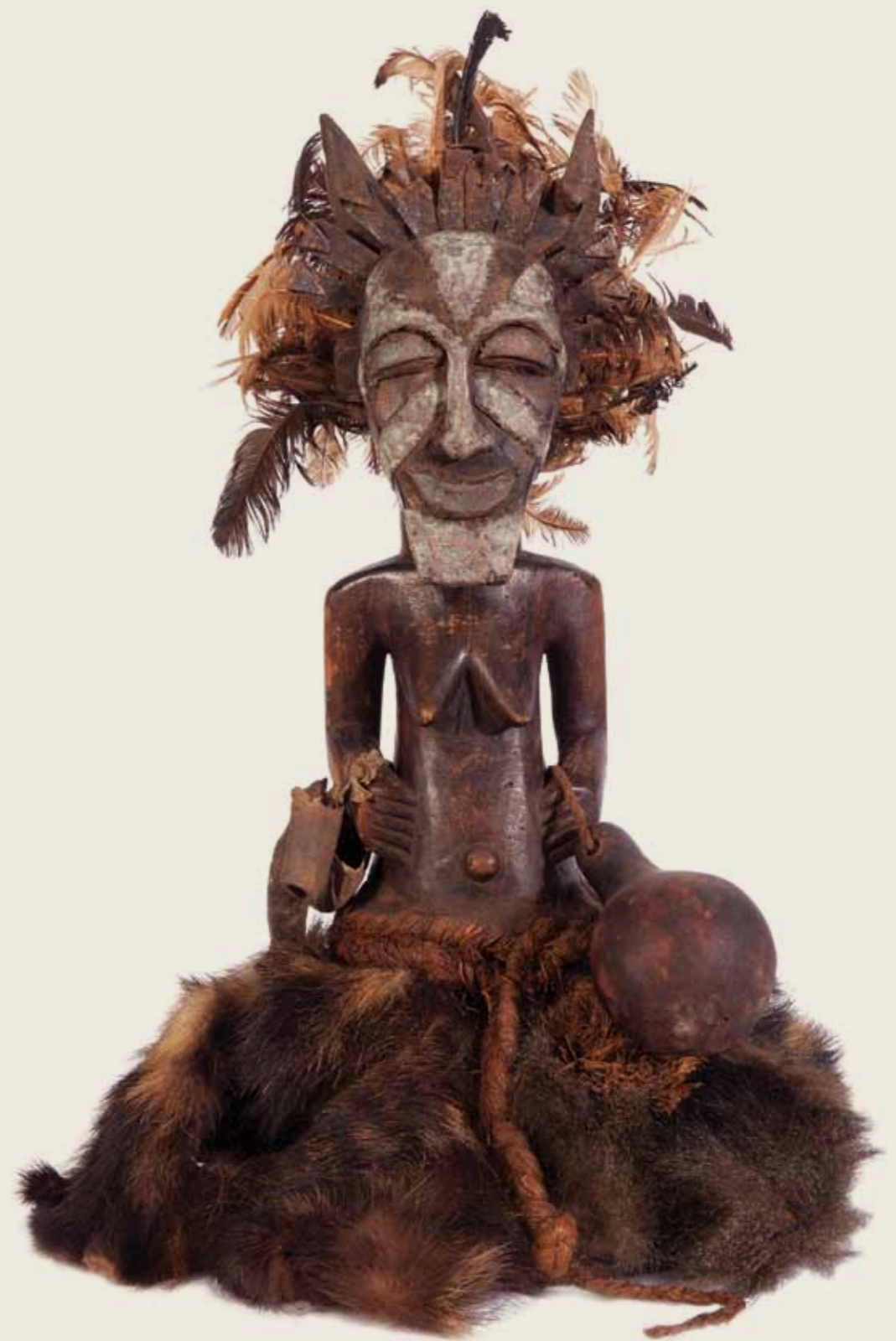
Estatueta Povo Songye (ou Songue; Songe) República Democrática do Congo Madeira, metal, cabaça, penas e pele animal 56,5 x 39,8 x 42,6 cm

Professora Doutora do Museu de Arqueologia e Etnologia da Universidade de São Paulo (MAE/USP)