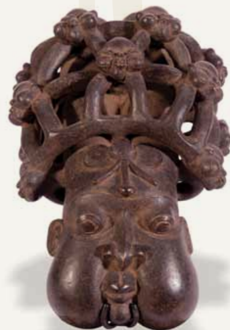
Bojo de Cachimbo Povo Bamum (Bamoun) ou Bamileque (Bamileke) República dos Camarões Cerâmica 40,5 x 26,5 x 20 cm

Observe, por exemplo, as duas esculturas selecionadas. Apesar de terem sido produzidas por artistas pertencentes a dois povos completamente distintos e situados em diferentes regiões da África, é possível perceber que ambas as figuras femininas representadas aparecem como símbolo de força e também de poder. A estatueta feminina attie, da Costa do Marfim, além de apresentar músculos inflados e uma postura imponente, evidenciando a sua força não apenas física, aparece sentada num banco, uma importante insígnia de poder. O penteado elaborado também corrobora com a ideia de que ela é uma mulher hierarquicamente importante. Já a mulher representada no banco luba, da República Democrática do Congo, não apresenta músculos aparentes, mas a sua força é evidenciada por ela sustentar a parte do assento apenas com as pontas dos dedos. A sua fisionomia de serenidade e calma comprova que ela não precisa fazer um grande esforço para “sustentar” o poder do chefe.