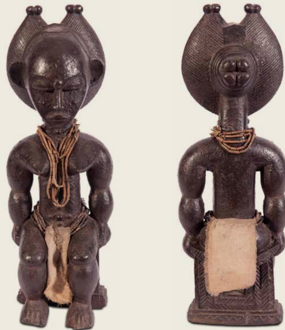
Estatueta Povo Attie (ou Akye) Costa do Marfim Madeira, tecido e contas 36,4 x 11,5 x 12 cm