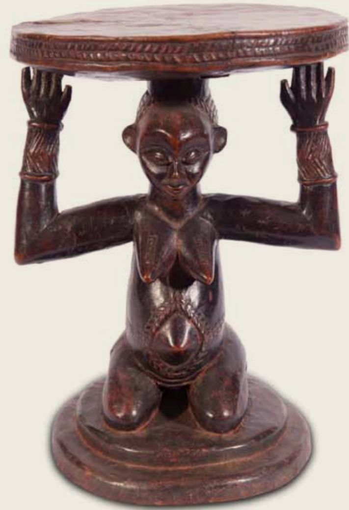
Banco Povo Luba República Democrática do Congo Madeira 35,5 x 26 x 21,7 cm

Os bancos em cariátide, em que chama atenção a figura feminina, estão relacionados ao espírito de importantes dirigentes do passado. Mas para o banco se tornar efetivamente um receptáculo do espírito de um chefe, a mulher ali esculpida precisa apresentar os atributos de beleza que potencializarão a comunicação com o mundo sobrenatural, como as escarificações, penteados elaborados e expressão de serenidade e sabedoria. Todos esses atributos podem ser observados neste banco que faz parte do acervo do Museu Afro Brasil. A figura feminina representada porta dois braceletes com marcas típicas do povo luba e revela ainda, em torno do umbigo, as escarificações, que são cicatrizes feitas na pele, marcadores de identidade e hierarquia.