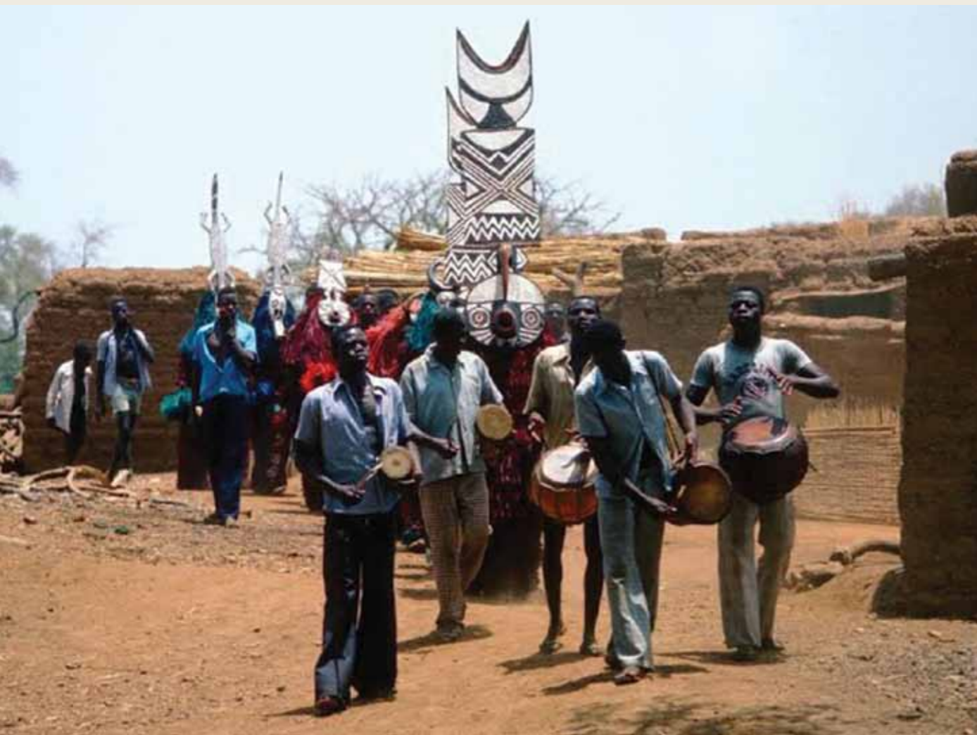
Mascarados em performance Povo bwa, Burkina faso, década de 1980 Christopher D. Roy