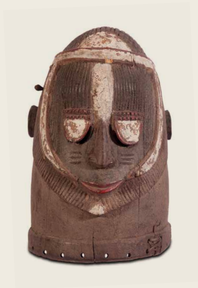
Máscara Povo Igala Nigéria Madeira policromada 35,5 x 25 x 27,5 cm