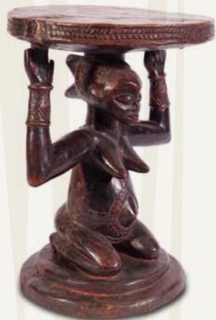
Banco Povo Luba República Democrática do Congo Madeira 35,5 x 26 x 21,7 cm

A representação da figura feminina na escultura é algo frequente em muitos povos da África. A interpretação mais comum desse tipo de produção, geralmente está baseada na ideia da maternidade. De fato, é recorrente a representação de mulheres acompanhadas de seus filhos na produção artística desse continente, no entanto, é preciso também analisar essas representações para além da ideia da mulher apenas como mãe.