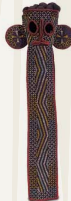
Máscara Elefante Povo Bamileque (ou Bamileke) República dos Camarões Tecido e Miçangas 112 x 39,5 x 25 cm

A história da República dos Camarões é marcada pela existência de hierarquizados reinos, localizados nas regiões de pradarias (Grasslands). Historicamente, esses reinos realizaram entre si muitas trocas econômicas, culturais e também artísticas, o que torna difícil e árdua a tarefa dos estudiosos em identificar precisamente obras advindas desse país. Materiais como as miçangas, presentes na máscara elefante dos bamileque, por exemplo, podem ser encontradas em produções artísticas de outros povos próximos, tais como em estatuetas e tronos do povo bamum. A circulação desses materiais entre diferentes reinos desmistifica a ideia de um continente africano cujas populações viviam de forma isolada. É preciso lembrar também que as miçangas que transitavam no Camarões eram advindas da Europa, o que demonstra que há séculos esses povos já tinham contatos estabelecidos fora do continente africano.