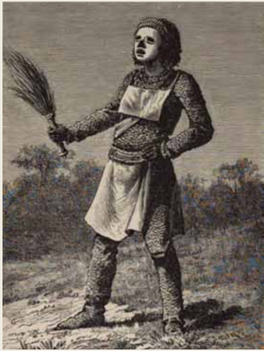
Mascarado Mwana Pwo Henrique Augusto Dias de Carvalho Expedição Portuguesa ao Muatiãnvua 1884-1888: Descrição da viagem à Mussumba do Muatiãnvua . Lisboa: Typ. O Jornal As Colônias Portuguesas, 1893. Vol. 3

Conhecidos tradicionalmente como exelentes caçadores e escultores, os tchokwe habitam atualmente em Angola, República Democrática do Congo e também na Zâmbia. O seu lugar de origem, no entanto, está localizado em Angola, onde os rios Kwango, Kassai e Lungwe-Bungo têm as suas nascentes.