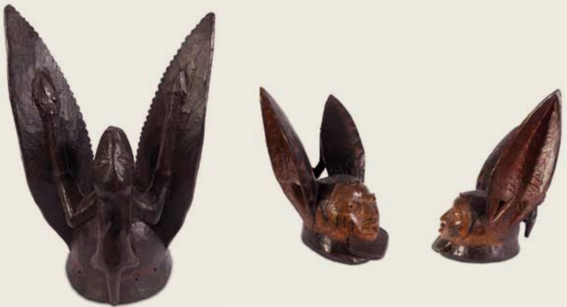
Máscara Egungun Povo Iorubá Nigéria Madeira pintada 46,3 x 28 x 36,5 cm

Na parte de trás das máscaras pode-se observar uma representação de coelho com suas orelhas pontiagudas. Este animal é visto como aquele que tem a capacidade simbólica de afastar as más influências. Uma vez que o coelho possui atividades noturnas, analogamente, a máscara de culto Egungun com representação desse animal é usada também à noite. Um dos exemplares aqui apresentados possui ainda uma dentição que faz referência à de um coelho. No acervo do Museu Afro Brasil é possível encontrar ainda outros tipos de máscaras Egungun , além de mais duas que apresentam como destaque a figura do coelho.