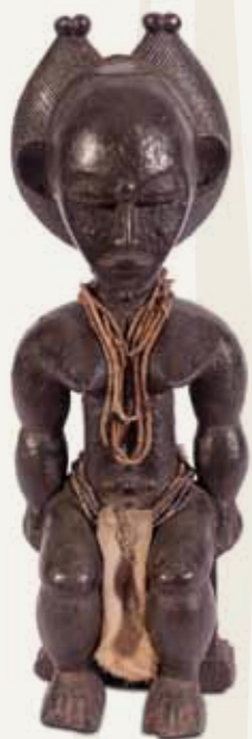
Estatueta Povo Attie (ou Akye) Costa do Marfim Madeira, tecido e contas 36,4 x 11,5 x 12 cm

O objetivo desta atividade é estimular professores e alunos a proporem possíveis diálogos entre as obras de arte africanas. As suas formas, materiais utilizados e características em comum, bem como os seus significados intrínsecos ou complementares devem ser explorados. Para isso, consulte os textos de base e a bibliografia sugerida.