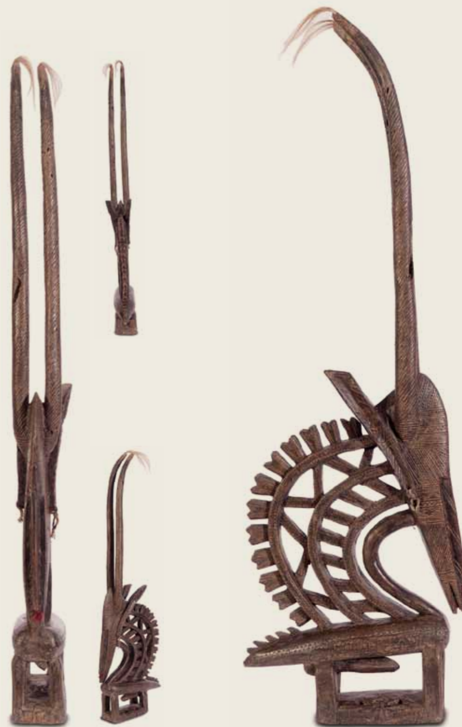
Máscara Tchiwara (ou Tyi wara, Tyi-wara) Povo Bamana (ou Bambara) República do Mali Madeira e pelo animal 97 X 31 X 8 cm

Enquanto a máscara tchiwara vertical reproduz um padrão comum na arte africana de esculpir através de um bloco único, a máscara horizontal é feita em duas partes unidas por pregos ou grampos.