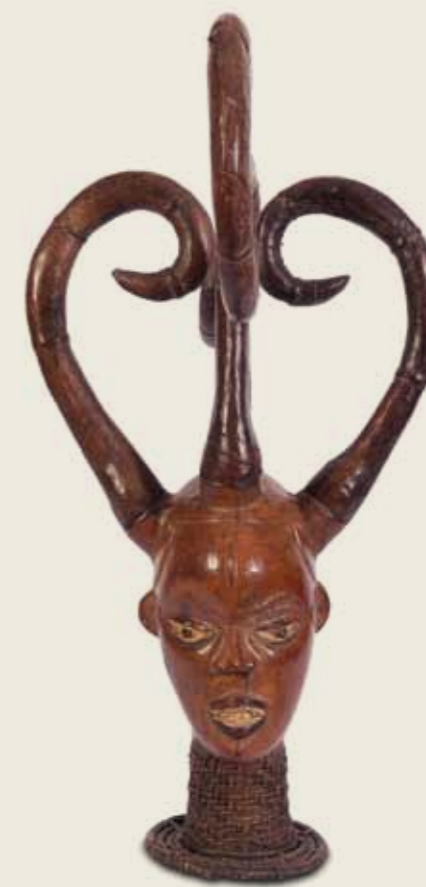
Máscara Povo Ejagham (ou Ekoi) Nigéria e República dos Camarões Madeira, fibra vegetal e pele de antílope 51,5 x 23 x 17 cm