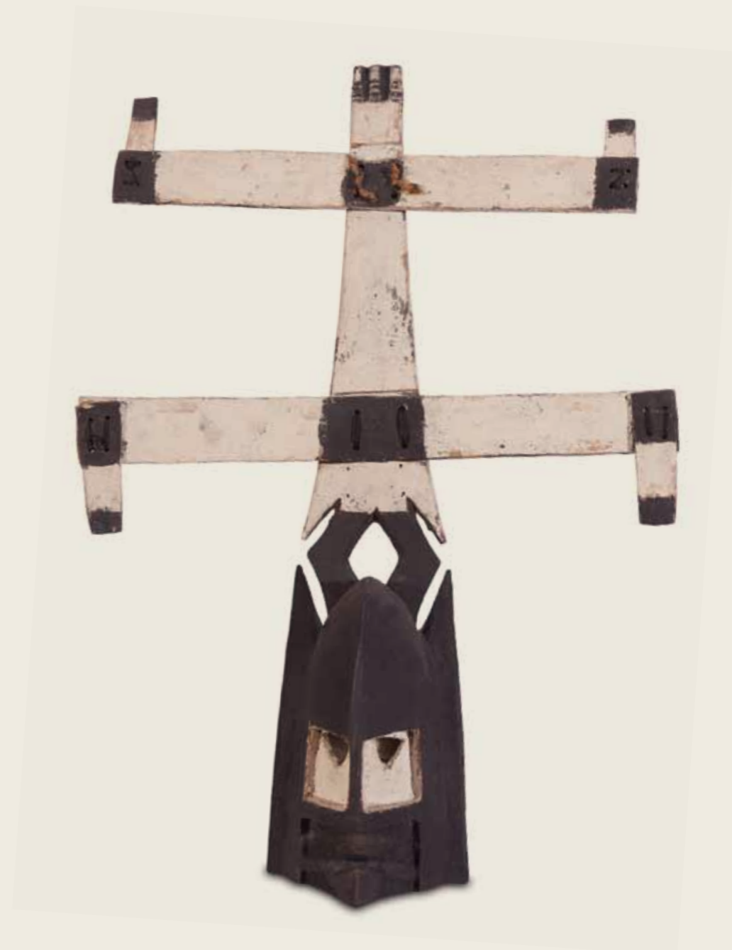
Máscara Kanaga Povo Dogon Mali Madeira e fibra vegetal 81 x 59,5 x 18,7 cm

Vilarejo de Amani, Próximo à Falésia de Bandiagara, Mali. 1994 | Gianni Puzzo