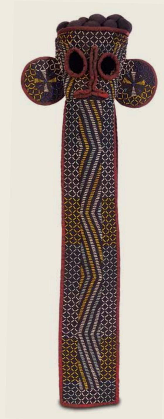
Máscara Elefante Povo Bamileque (ou Bamileke) República dos Camarões Tecido e miçangas 112 x 39,5 x 25 cm

Os motivos costurados e com enfiadas de contas da máscara referem-se às manchas da pele de animais como o leopardo que, assim como o búfalo, tem sua imagem ligada à realeza.