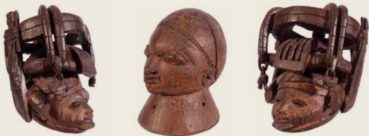
Máscaras Gueledé Povo iorubá Nigéria Madeira 40,5 x 36 x 45,5 cm e 24,2 x 16,5 x 21 cm