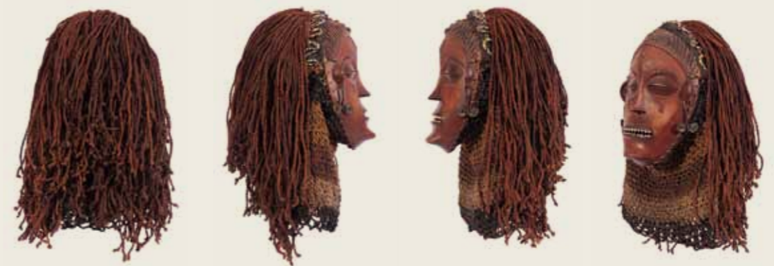
Máscara Mwana Pwo ou Pwo Povo Tchokwe (ou Chokwe, Cokwe, Quioco) Angola Madeira pintada, miçangas, metais e fibra vegetal 41 x 26 x 27 cm