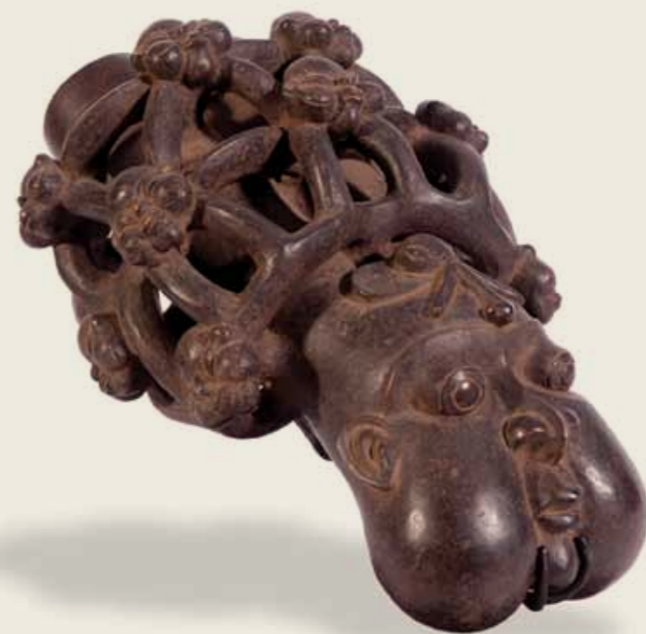
Bojo de Cachimbo Povo Bamum (ou Bamoun) República dos Camarões Cerâmica 40,5 x 26,5 x 20 cm