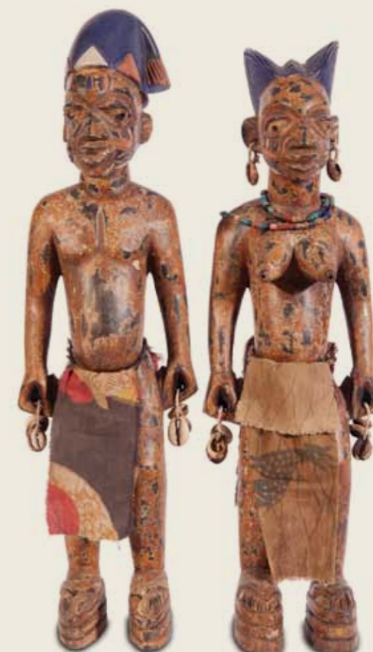
Estatueta de Gêmeos (Ibeji) Povo Iorubá Nigéria Madeira 24 x 8 x 7 cm