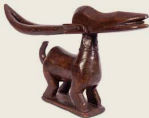
Máscara Tchiwara ou (Tyi wara, Tyi-wara) Povo Bamana (ou Bambara) República do Mali Madeira, couro e metal 26,3 x 56,2 x 8,5 cm

As máscaras tchiwara podem ser verticais ou horizontais. As verticais são tradicionalmente esculpidas através de um bloco único de madeira, enquanto as horizontais são quase sempre produzidas em duas partes unidas por grampos ou pregos. A união das duas partes da tchiwara horizontal representa a junção entre os dois mundos que a colheita se refere: um é o mundo da vegetação na superfície, que é relacionado ao dia; e o outro é o mundo subterrâneo, que é associado à noite, ao alimento e à fertilidade da terra. Destaca-se aqui um alimento básico na dieta dos povos bamana que é a voandzeia subterrânea , mais conhecido como “feijão da terra”.