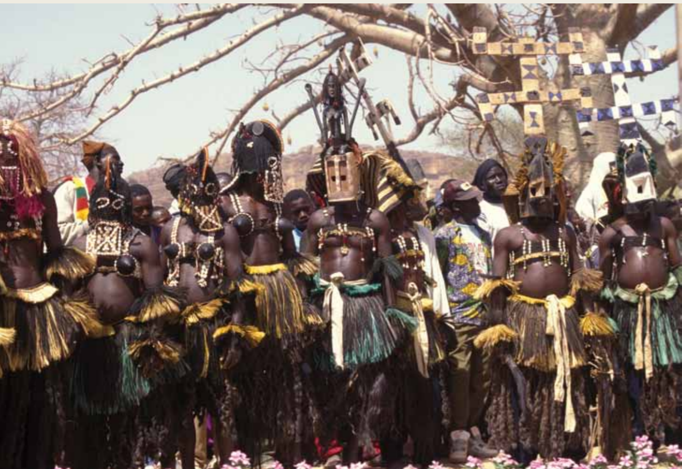
Vilarejo de Amani, Próximo à Falésia de Bandiagara, Mali. 1994 | Gianni Puzzo