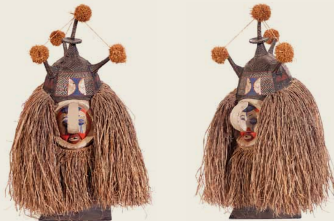
Máscara Povo iaca República Democrática do Congo Madeira pintada, fibra vegetal 69 x 46,7 x 48,3 cm