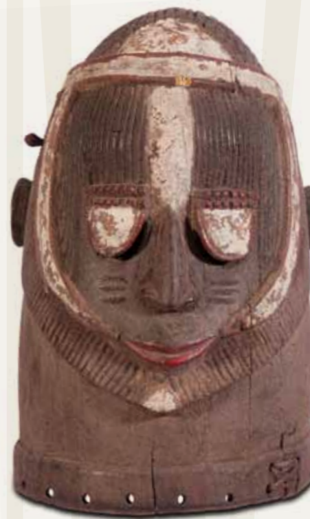
Máscara Povo Igala Nigéria Madeira policromada 35,5 x 25 x 27,5 cm

Máscaras africanas não são apenas aqueles objetos presos à face ou à cabeça. Podemos dizer que elas são resultantes de um "conjunto multimídia". Além da parte que adorna a cabeça ou o rosto, geralmente produzida em madeira, integra também esse conjunto chamado "máscara" uma vestimenta feita em diferentes materiais, como tecidos e fibras vegetais, além de uma série de apetrechos que adornam todo o corpo do mascarado, incluindo por vezes, adereço de dorso, joias e adornos nos braços, pescoço, pernas etc.