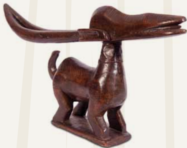
Máscara Tchiwara ou (Tyi wara, Tyi-wara) Povo Bamana (ou Bambara) República do Mali Madeira, couro e metal 26,3 x 56,2 x 8,5 cm