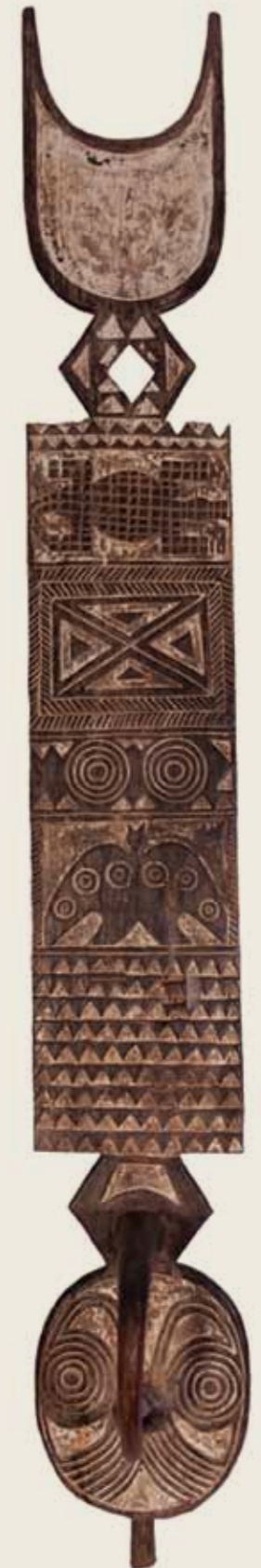
Máscara placa (Nwantantay) Povos Bobo, Bwa (Bwaba ou Oule) Burkina Faso Madeira pintada 232 x 45 x 34 cm