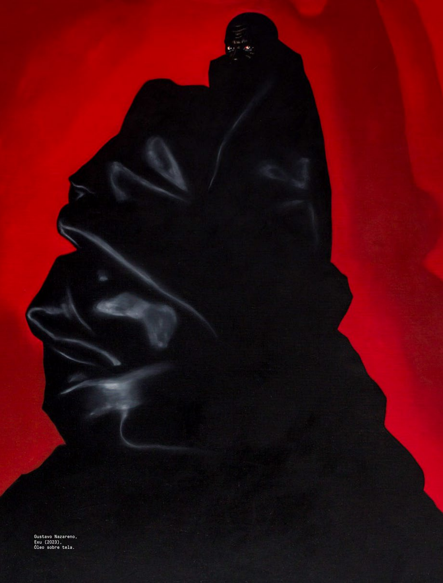
Gustavo Nazareno, Exu (2023), Óleo sobre tela.