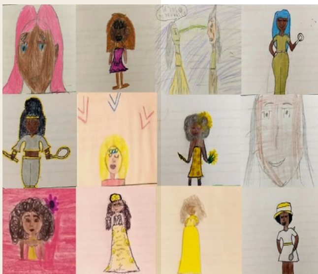
Ilustrações da princesa orixá Oxum pelas/os estudantes dos 6ºs anos da EMEF Saturnino Pereira. 2023.