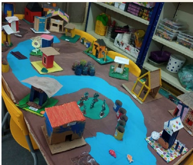
Projeto: A Favela dos meus sonhos. Maquete realizada com a participação das crianças e famílias da/na EMEI Cidade Ademar III, baseada na história de Carolina Maria de Jesus, na extinta favela do Canindé. 03 de outubro de 2023.