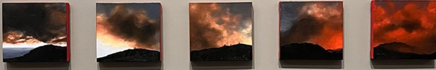
Gustavo Nazareno, série Nuvem Carmesim (2023), óleo sobre tela

É a partir dessa lógica e dessa discussão que adentramos à exposição individual de Gustavo Nazareno. Em Bará, iniciamos como uma ode à morte (como momento primordial de transformação) e aos ancestrais. Fazemos um percurso por uma estrada ao longo do dia, como retratado pela série Nuvem Carmesim (2023).