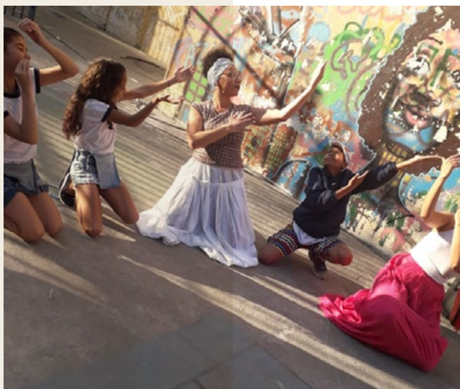
Aula de dança da princesa orixá Oxum no pátio da EMEF Saturnino Pereira. 2023.