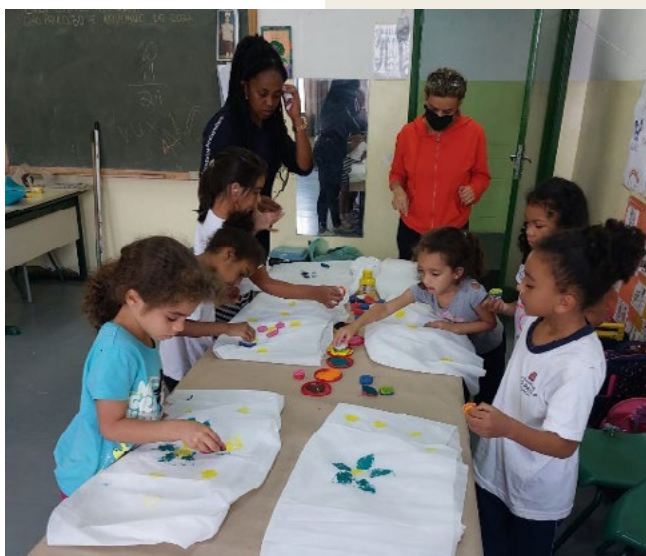
Projeto: Músicas que contam histórias. Pintura das roupas realizadas pelas crianças da EMEI Cidade Ademar III, onde apresentaram a música "Um sorriso negro". Para tal, foram estudadas a vida e ascensão de D Ivone Lara, as dificuldades que ela atravessou em seu percurso por ser mulher, mulher negra, até ser reconhecida e se tornar a primeira mulher a assinar um samba enredo e fazer parte da ala de compositores da escola de Samba Império Serrano. 30 de novembro de 2022.