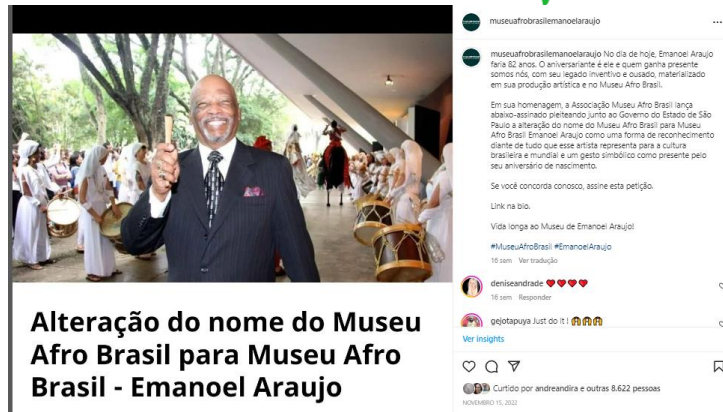
Campanha online para mudança do nome do Museu – redes sociais