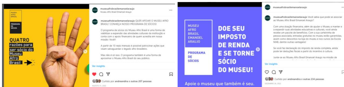
Campanhas do Programa de Sócios no no Instagram

Campanhas voltadas ao desenvolvimento do Programa de Sócios foram realizadas em diferentes momentos, com uma reformulação do Programa realizada no segundo quadrimestre e novas campanhas lançadas em novembro e dezembro, articuladas à doação do imposto de renda pessoa física para a instituição.