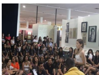
Aos Pés do Baobá