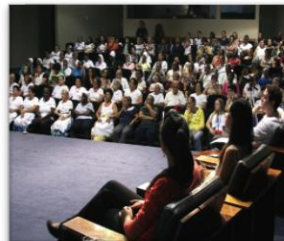
I Ciclo de Seminários sobre Práticas Educativas

O número de visitantes presenciais no museu atingiu 162.690 visitantes presenciais, significando o percentual de 95,7% em relação ao pactuado. Embora o atingimento da meta se encontre dentro do limite de oscilação de público aceito pela UPPM-SC, reafirmamos o compromisso do museu em manter e ampliar um conjunto de ações voltadas à formação de público e divulgação da sua programação. O público virtual do museu totalizou 437.366 visitantes no ano - considerando apenas acessos únicos. Um conjunto planejado de ações colaborou para esse resultado: a manutenção da inserção do Museu nas redes sociais, a ampliação de conteúdos sobre o acervo do museu no site, o estabelecimento de parcerias voltadas para a divulgação da programação cultural e acesso ao acervo do museu.