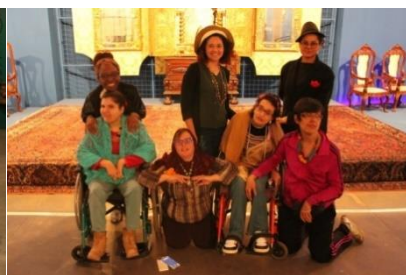
Público com deficiência