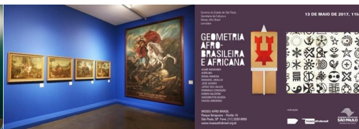
Geometria Afro-Brasileira e Africana

Para além das exposições temporárias previstas, o Museu organizou mostras a partir de recortes do acervo que ocuparam tanto os espaços externo do Museu- marquise e paredes envidraçadas; como espaços dentro da exposição de longa duração e pequenos ambientes do pavimento destinado às exposições temporárias, conforme apresentado nos relatórios trimestrais anteriores.