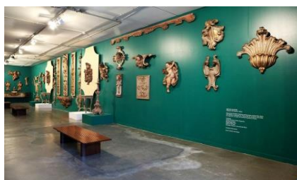
Barroco Ardente e Sincrético - Luso-Afro-Brasileiro