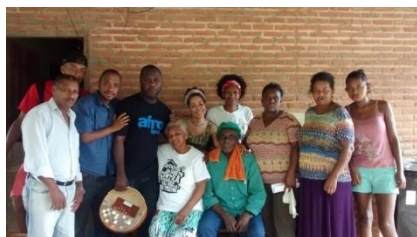
Visita ao Quilombo São Pedro

Os relatórios específicos foram enviados ao SISEM-SEC-SP, no período referente à realização das ações.