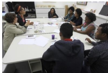
Oficina de Mapeamento Cultural-MAB